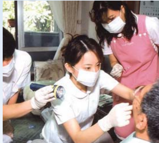
在宅歯科訪問の診療風景

通院困難な方のために、歯医者さんが往診! 治療・ケアは、「適正」「安心」「清潔」をお約束します。