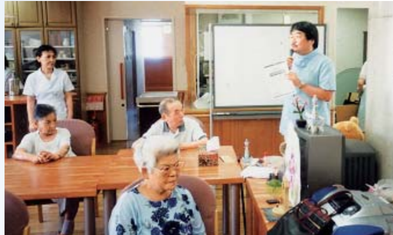
お口の健康相談風景