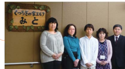
「くつろぎの家エルフ・みと」のスタッフの方々

介護スタッフの残業時間を減らすことができました。以前は、介護記録は手書きで行っていましたが、やはり入居者様への介助が優先されるため、記録は後回しにせざるを得ないこともあり、介護スタッフの方には残業をして介護記録をとってもらっていました。しかし、導入後は記録時間が軽減されています。