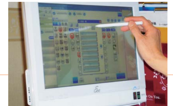
タッチパネルで簡単入力。同時に入居者様を観察することも